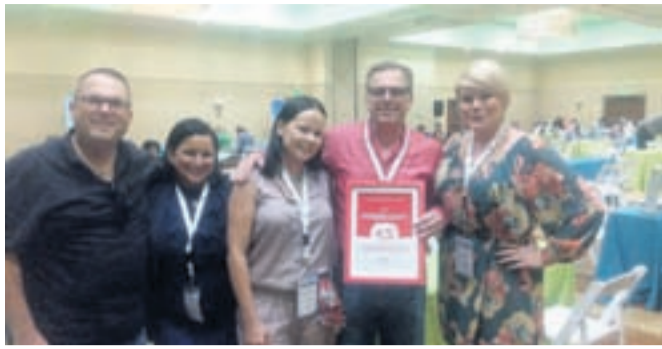
Amsterdam Manor Beach Resort reconoci pa Hotels.com Les a B13